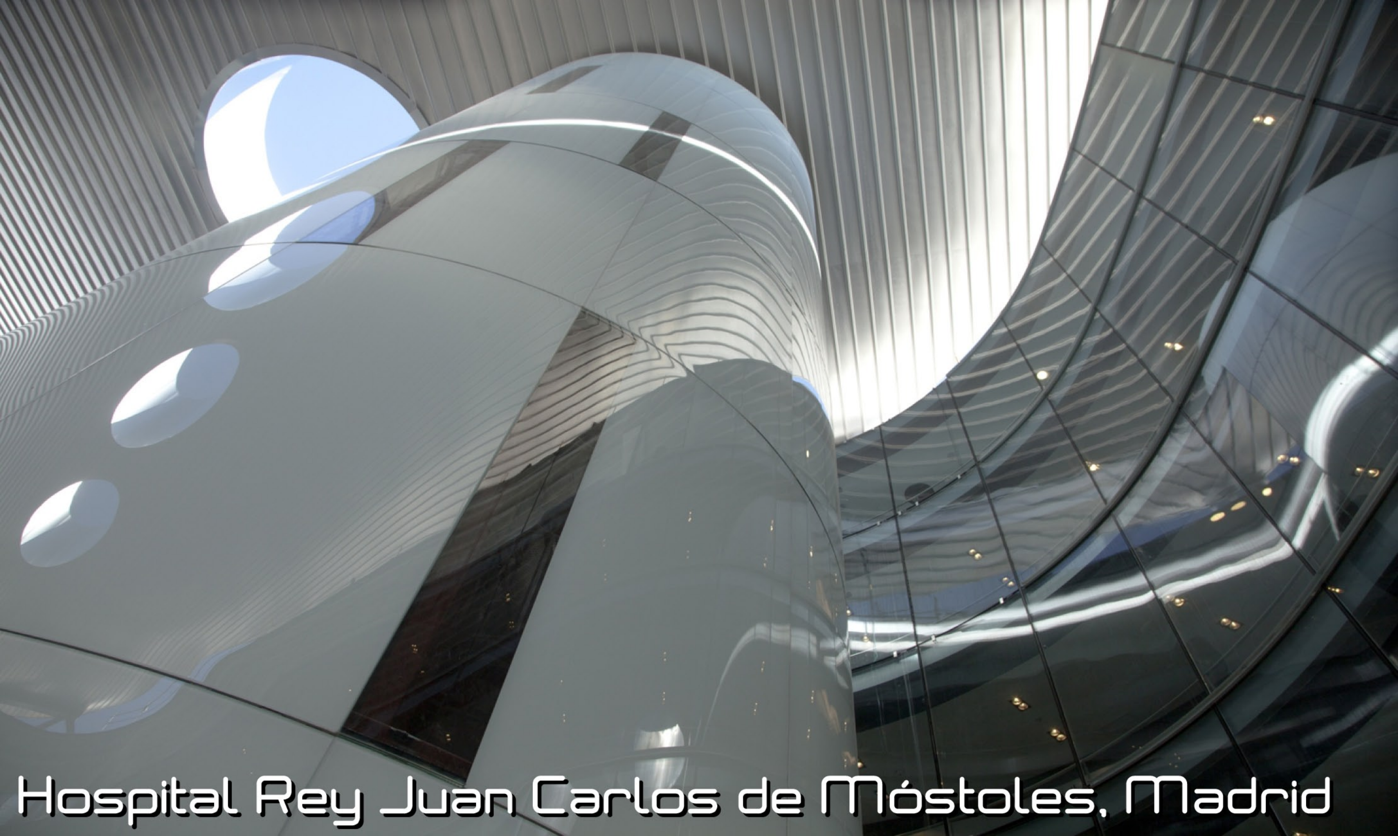
Hospital Rey Juan Carlos de Móstoles, Madrid