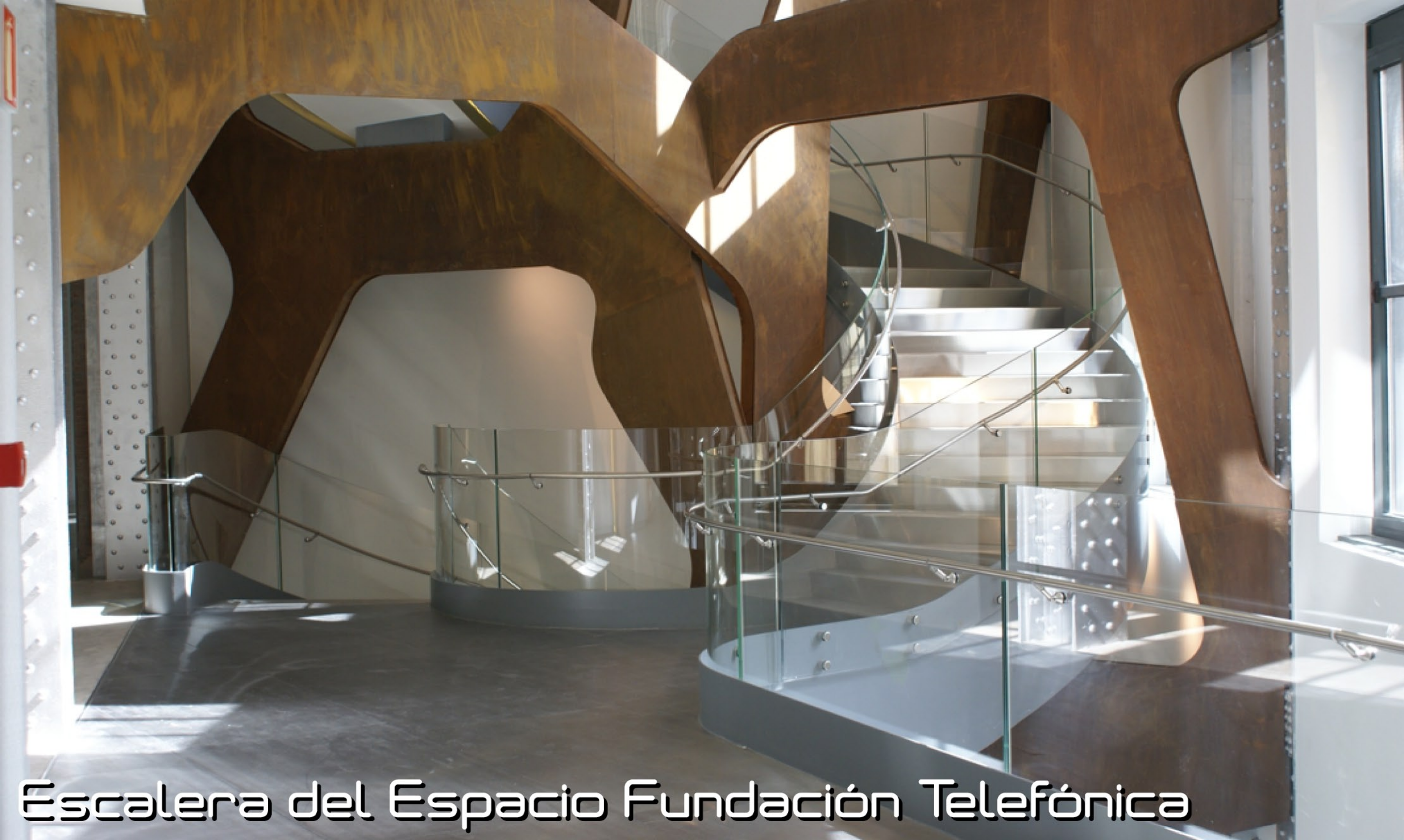
Escalera del Espacio Fundación Telefónica