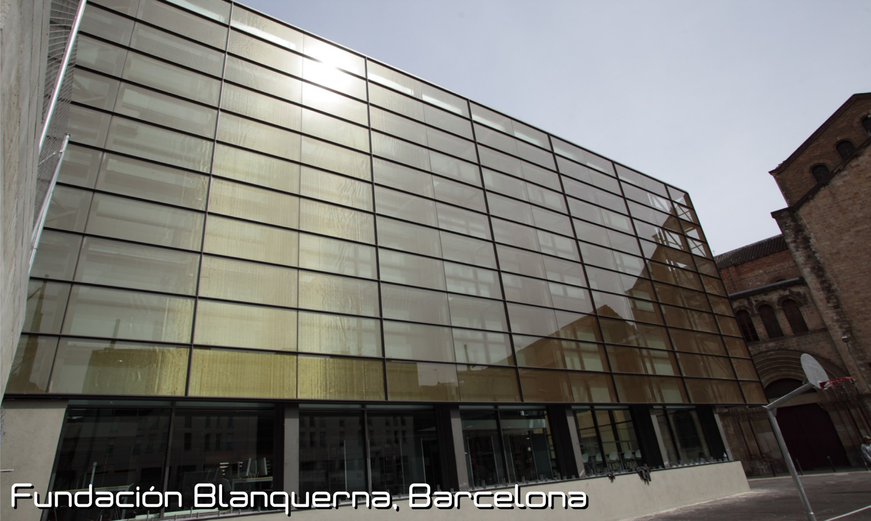
Fundación Blanquerna, Barcelona