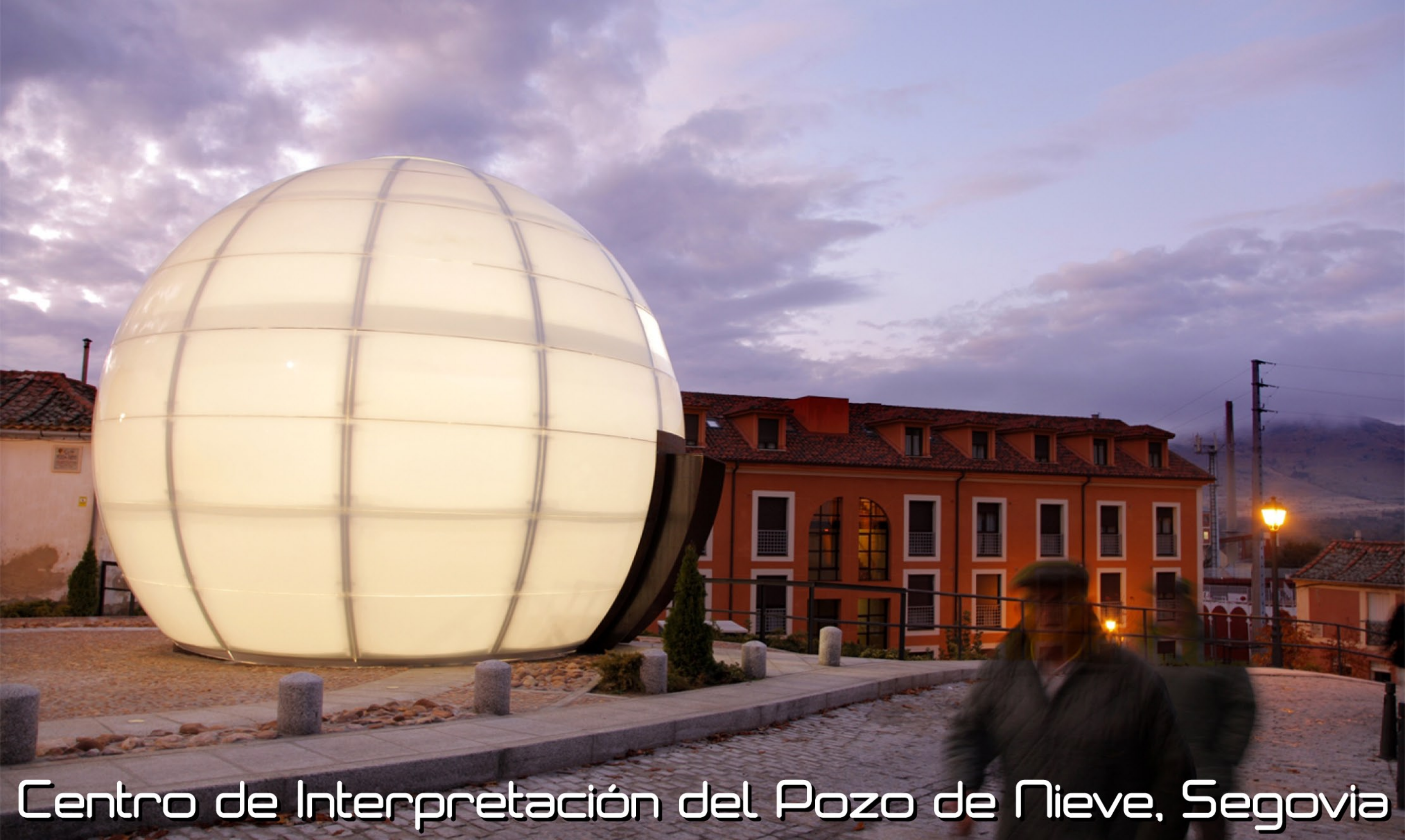
Centro de Interpretación del Pozo de Nieve, Segovia