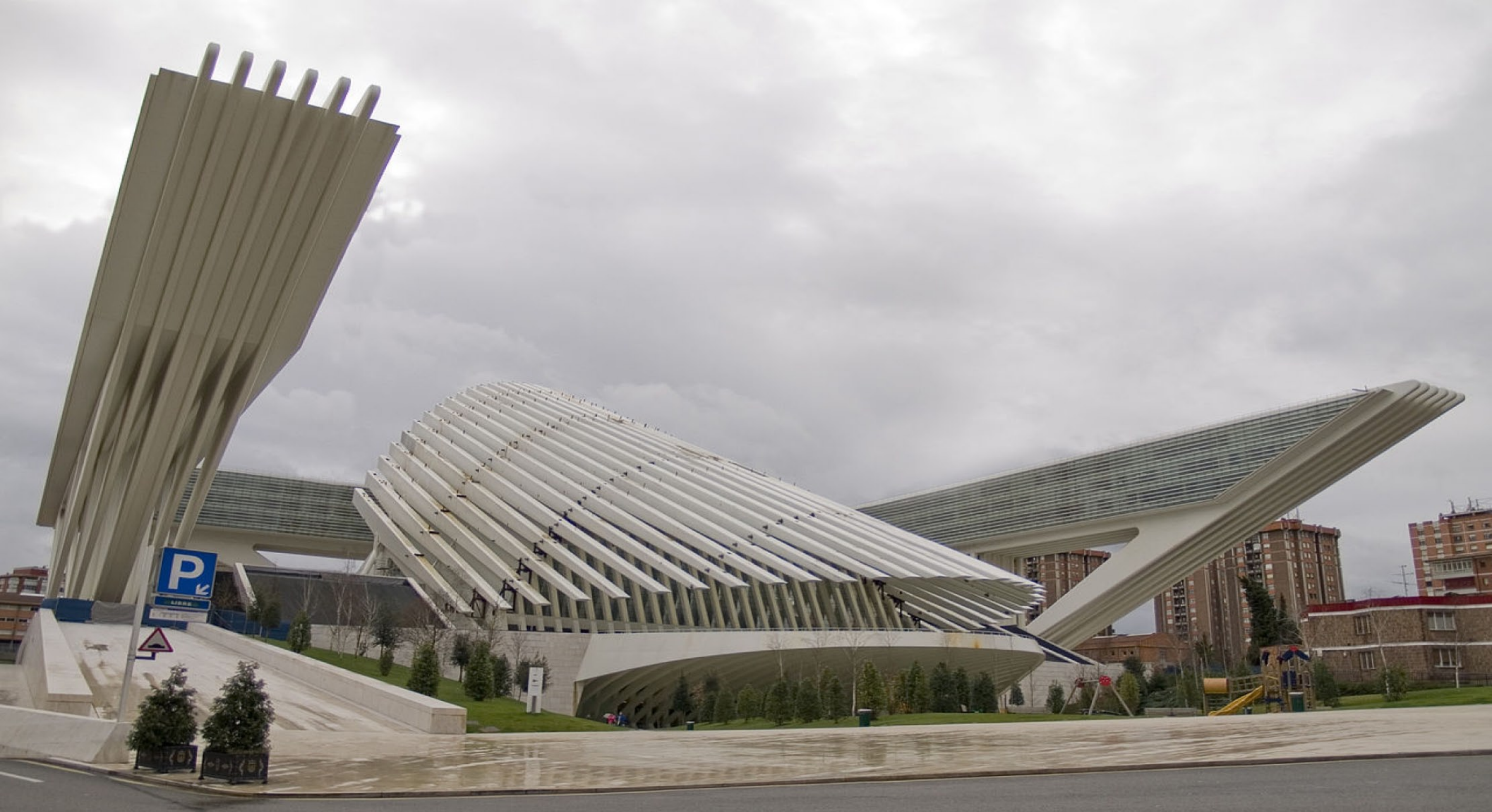
Palacio de Congresos Princesa Letizia, Oviedo