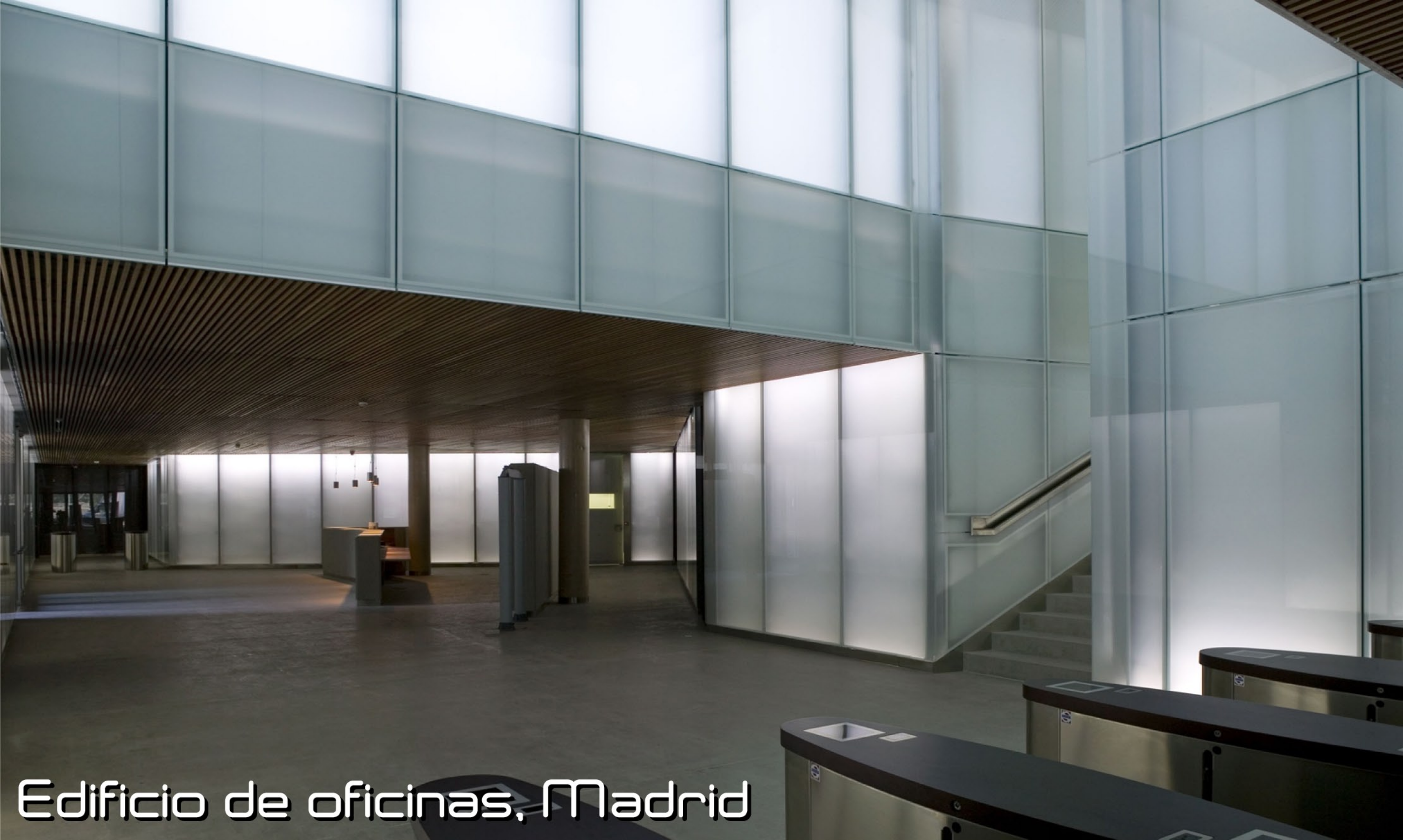
Edificio de oficinas, Madrid